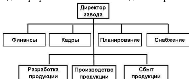
Рис.1 Структура управления

Студентам необходимо заполнить пустые графы. При этом необходимо учитывать, что в каждой графе может быть более одного варианта.